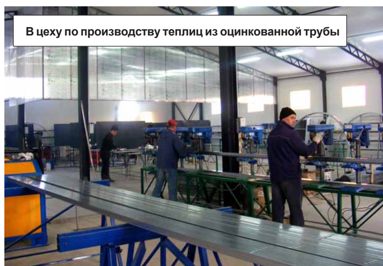
В цеху по производству теплиц из оцинкованной трубы

С непроверенными фирмами предприятие не работает. Весь материал, из которого изготавливаются теплицы, произведен в соответствии с ГОСТом и имеет сертификаты качества. Недавно в Черкесске у самого крупного производителя поликарбоната в России фирмы «Юг-ойл-