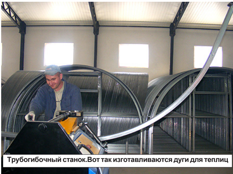
Трубогибочный станок. Вот так изготавливаются дуги для теплиц